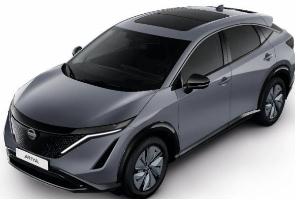
Szary ceramiczny [KBY]

Lakier metalizowany / perłowy (jednokolorowe nadwozie) – BEZ DOPEŁATY