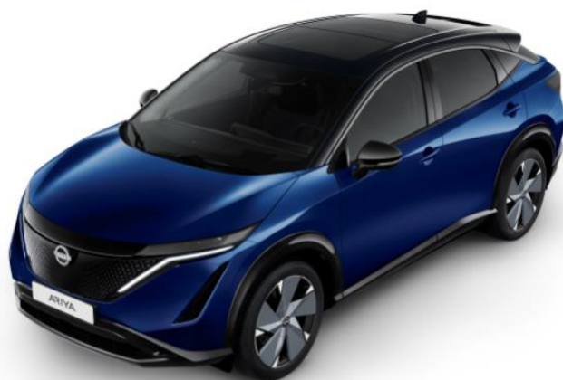
Niebieski perłowy + czarny dach i lusterka [XGU]