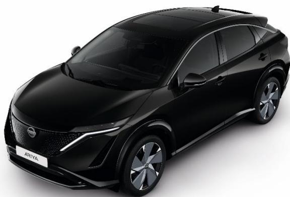
Czarny perłowy [GAT]