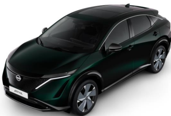
Zielony perłowy AURORA [DAP]