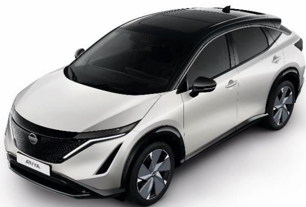
Biały perłowy + czarny dach i lusterka [XGA]

Lakier metalizowany / perłowy + dach i lusterka w kolorze czarnym – dopłata: 5 000 zł 1