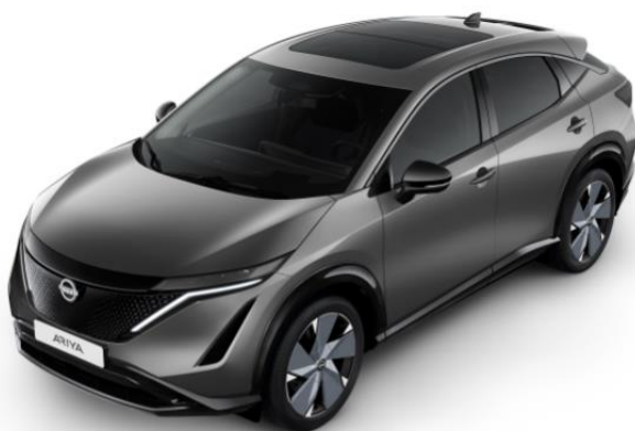
Szary metalizowany [KAD]