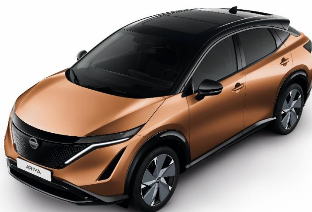
Miedziant Akatsuki + czarny dach i lusterka [XGJ]